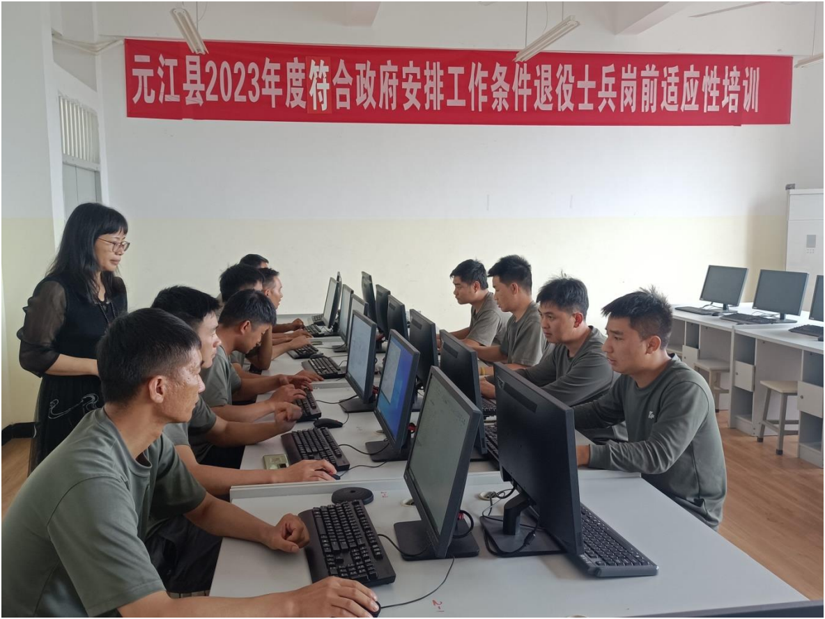
图3 退役士兵岗前适应性培训