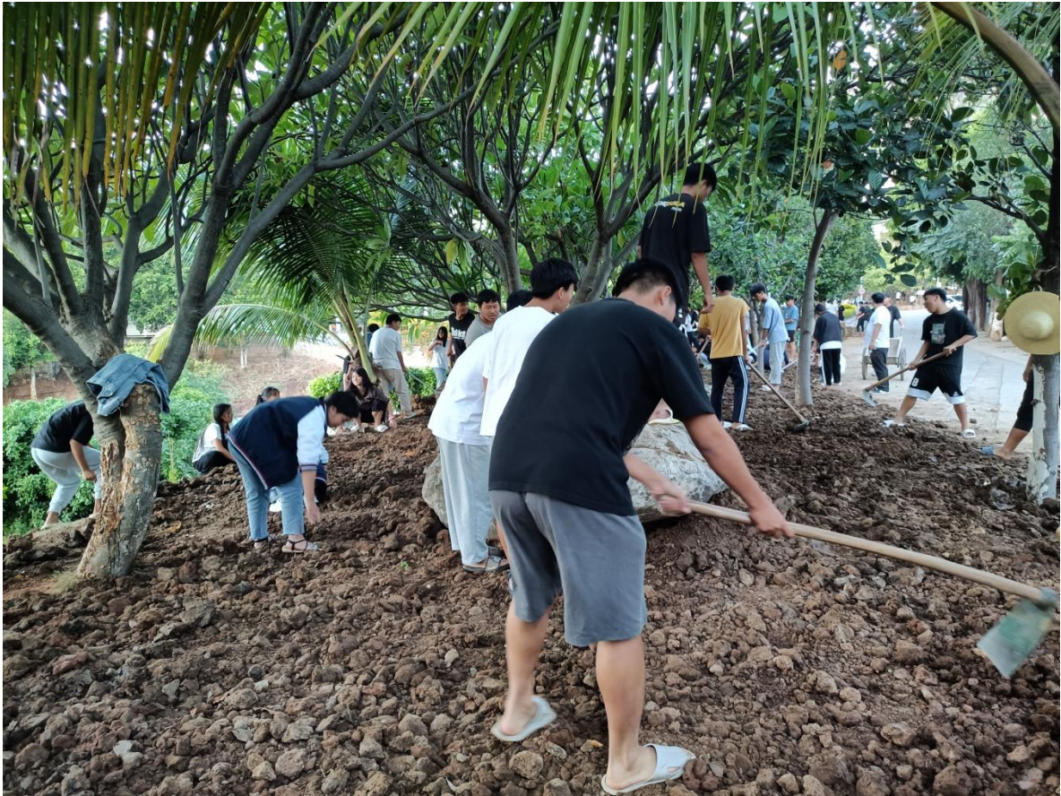
图2 师生携手共建校园