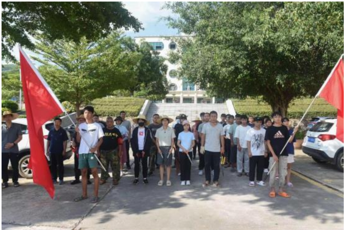
图 1 党建带团建

通过实践活动，知行合一，元江职中师生携手扮靓美丽校园，进一步增强了自身的环保意识、生态意识和志愿服务意识。全体人员纷纷表示要以实际行动践行党和国家提出的“绿水青山就是金山银山”的理念，积极发挥党员、团员的先锋模范作用，携手共进，为生态文明校园建设贡献青春力量。