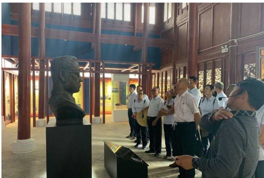
图 5 元江职中党支部参观李和才故居

时间砥砺信仰，岁月见证初心。百年来，中国共产党团结带领中国人民砥砺奋进、自强不息，实现了伟大的历史跨越，见证了磅礴的中国力量！学校全体教职员工将铭记党的光辉历史，传承党的红色基因，办好人民满意的教育。