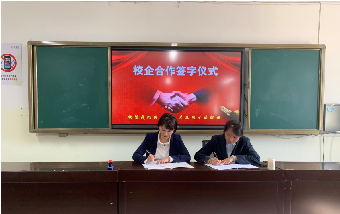
图 6 校企合作签字