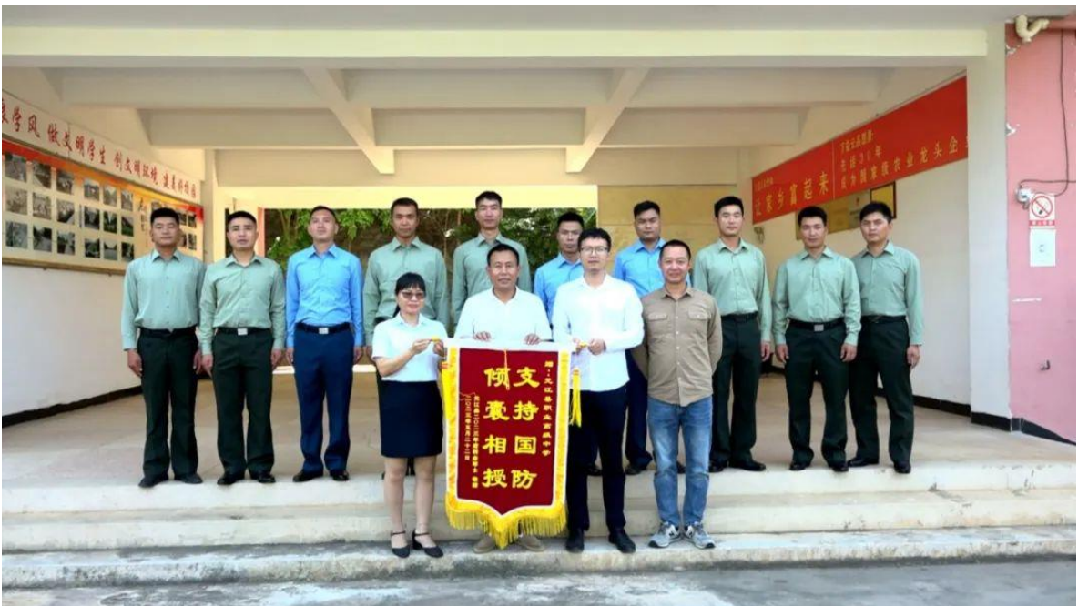
图4 支持国防 倾囊相授