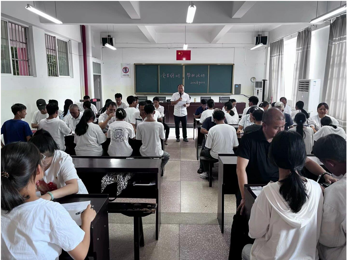
图 8 党员结对帮扶

学校将持续性开展党员教师帮扶学生工作，做到“不漏一户，不落一人”，将扶贫、扶志、扶智紧密结合，帮助学生健康、快乐的成长。